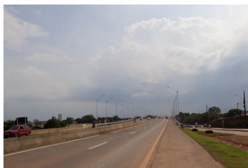
Viaduto da Camoós Sales