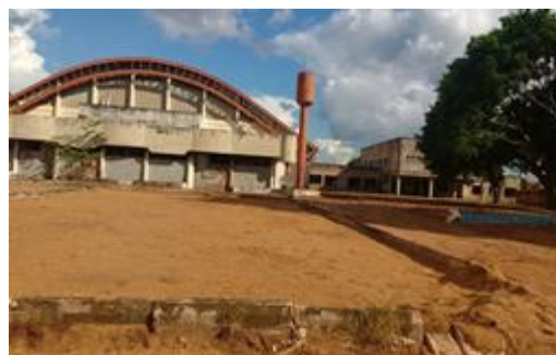
Foto 04 - Parceria na Recuperação do Parque Aquático complexo Esportivo Vinícius Danin