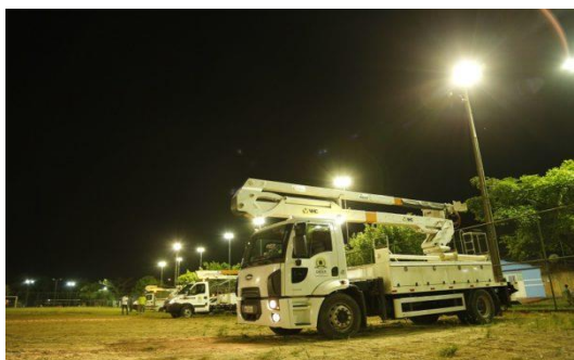
Foto 03 - Complexo Esportivo do Conjunto Jamariz