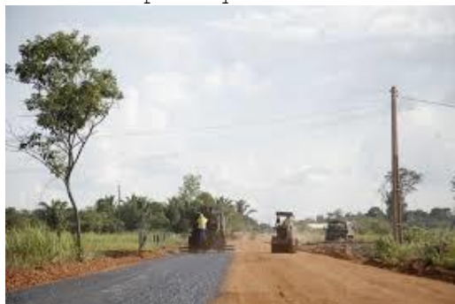
Rua Goianésia Recebendo Asfaltamento

2.2.5 Para efeito de estimativa adotaremos para um período de 12 meses um acréscimo estimado de 40%, considerando que a Prefeitura Municipal de Porto Velho vem implantando gradativamente o asfaltamento em ruas e vias e, em algumas, é fato que há carência em sua totalidade de Iluminação Pública. Podemos citar como exemplo a Rua Goianésia. O quantitativo e tipo de insumos (areia, brita e cimento) sofrem variações de acordo com o "para que e como serão utilizados".