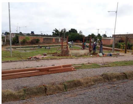
Foto 01 - Mutirão para reconstrução do Eco Parque Pirarucu do Madeira -

2.2.1 No Ano de 2018 os trabalhos realizados envolveram serviços abaixo como exemplo: